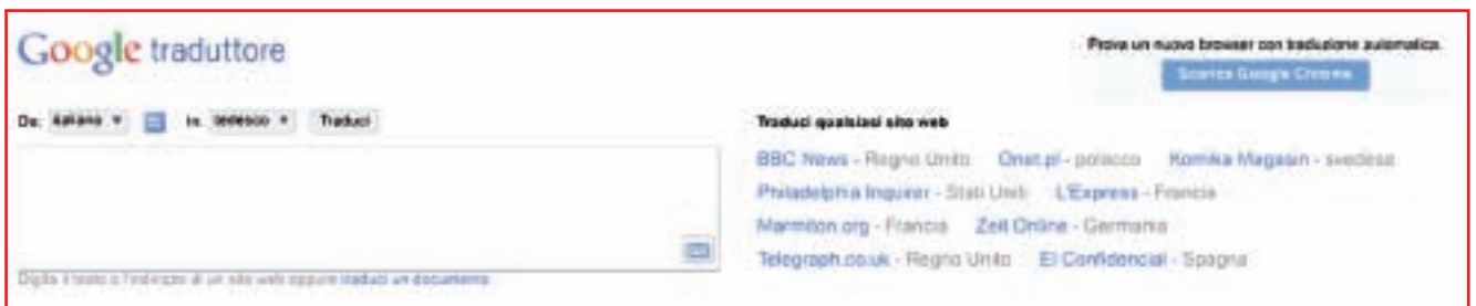
Uno dei traduttori online più famosi e utilizzati: Google Translate

informazione sulla grammatica e spesso non possiede nemmeno un dizionario. L'idea su cui si fonda è piuttosto semplice, ma incredibilmente produttiva: se noi disponiamo di una grande raccolta di testi in originale e in traduzione per una coppia di lingue (il cosiddetto corpus parallelo ) possiamo estrarre in modo automatico le corrispondenze più frequenti tra 'pezzettini' o segmenti di frasi. Insieme alle corrispondenze o equivalenze estrarremo anche la probabilità che un dato segmento in certi contesti venga tradotto in un modo piuttosto che un altro.