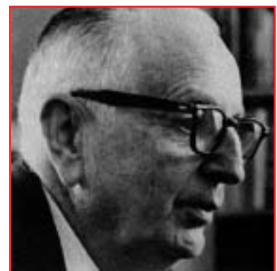
Warren Weaver (1894-1978)

La seconda tipologia, quella che ha rivoluzionato il panorama delle traduzioni negli ultimissimi anni, è la traduzione automatica statistica ( statistical machine translation ). Questo tipo di sistema usa pochissima